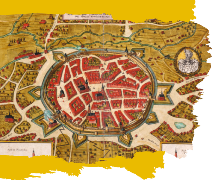
Die Befestigung Zittaus im Dreißigjährigen Krieg, kolorierter Kupferstich, Merian 1650, Städtische Museen Zittau